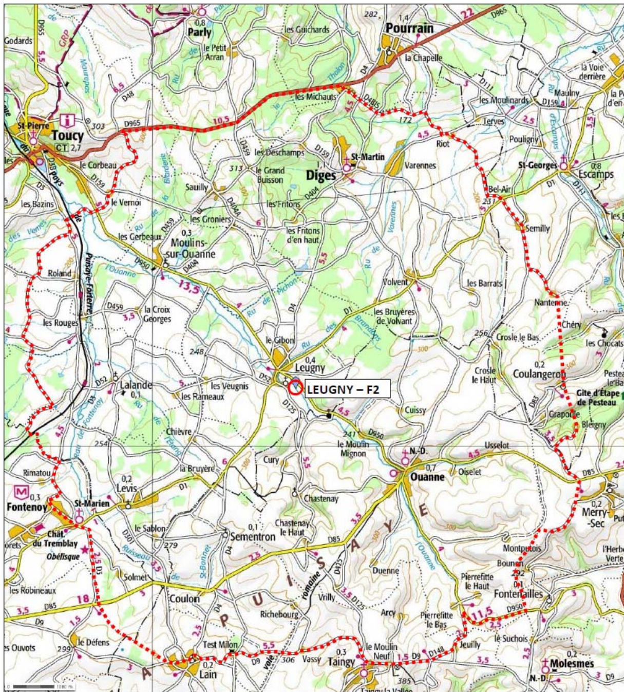
Périmètre de protection éloignée